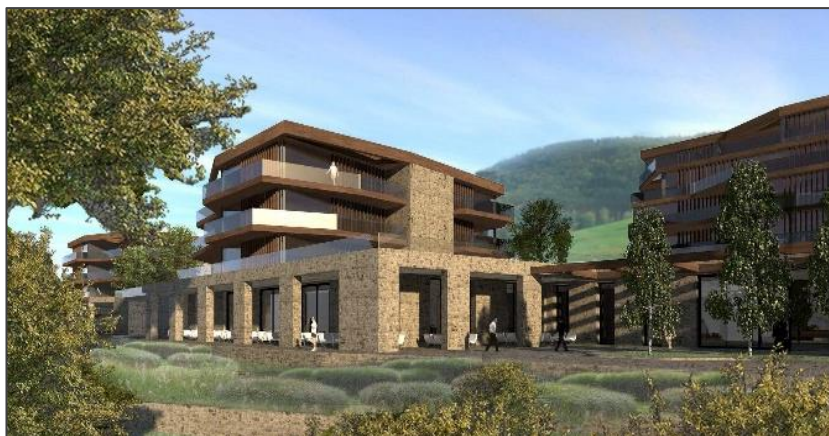
Visualisierung des geplanten Neubaus (Ausschnitt), siworks immo AG